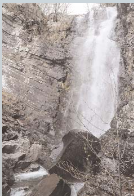
"PISCIAROTTA" DELLA FARFARÀ

ma non senza difficoltà - risalento il torrente stesso dal guado iniziale. La cascata è immersa in un ambiente di particolare interesse, fino a pochi decenni fa, dalla popolazione locale anche per coltivazioni e pascoli.