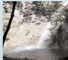
"PISCIO" DI PRACCHIOLA

Da Pracchiola, un sentiero (senza difficoltà ma lungo il quale va prestata attenzione) attraversa boschi di castagni e cerri e conduce in circa 30' al letto del fiume che si risale per poche decine di metri fino a scorgere lo spettacolo della cascata che precipita dall'alto di una parete di pietra arenaria con un salto di oltre 30 metri per gettarsi in un lago. Ci si trova a circa 700 m slm, quasi alle sorgenti del fiume Magra: è questa, forse, la cascata più suggestiva della Lunigiana.